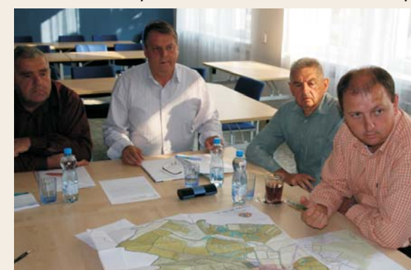
Pozemková úprava - schůzka sboru zástupců