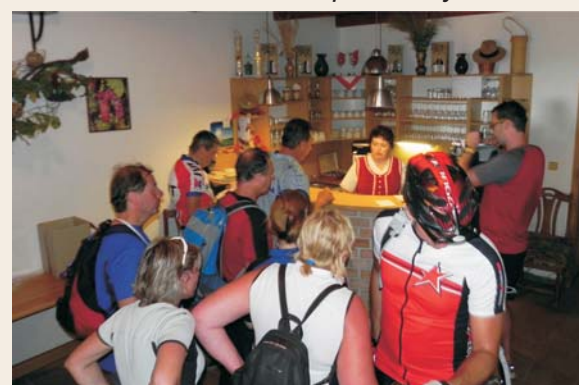
Putování za burčákem po Modrých Horách