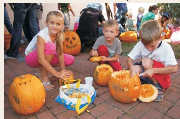
Veselé Dýňobraní 2011