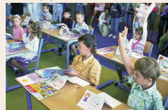
Prvňáčci poprvé ve školních lavicích