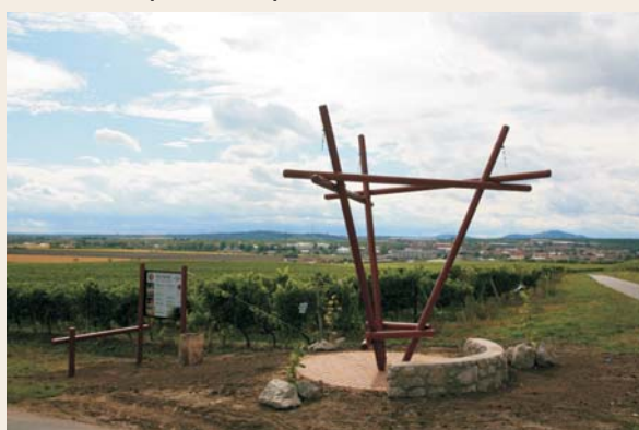
Nová odpočívka pod rozhlednou Slunečná