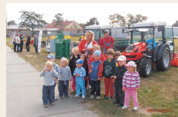
Mateřinka na exkurzi na Hantálech