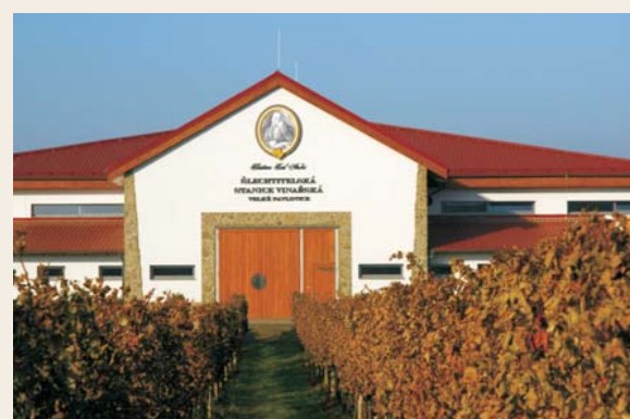
Nová budova Šlechtitelské stanice vinařské, a.s.