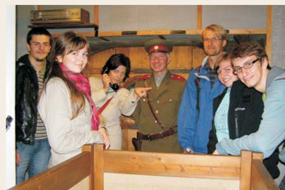
Maturanti na výletě v Praze