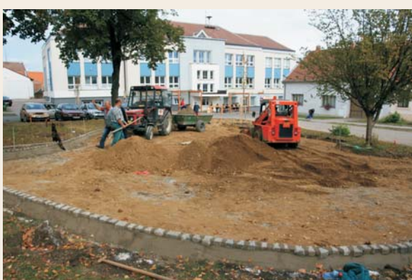
Budování parčíku u kostela